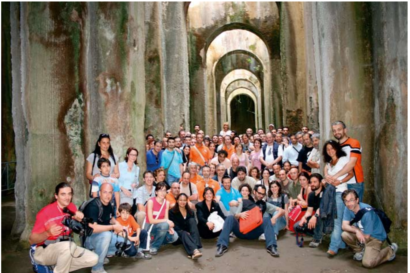
Piscina Mirabilis, Bacoli 1 giugno 2008, foto ricordo dei partecipanti. Piscina Mirabilis, Bacoli 2008 June 1, photo of the conveners.

L'auspicio e l'augurio è che queste potenzialità e questa maturità, nel pieno rispetto delle identità dei singoli gruppi che la compongono, siano anche per le future generazioni di speleologi campani sinonimo di esplorazioni, ricerche e collaborazioni intergruppi principi base sui quali poggia le fondamenta e si rafforza lo spirito federativo e la speleologia vera.