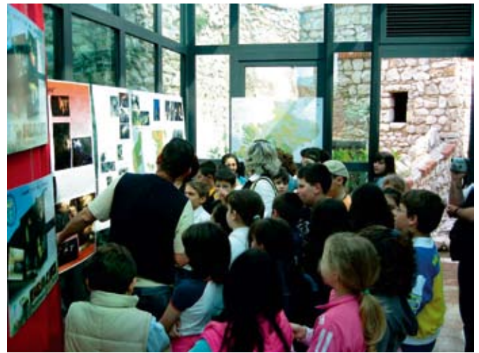
Scolaresche in visita alla mostra allestita in occasione del I convegno regionale. School-children visit the showroom during the first regional conference of speleology.