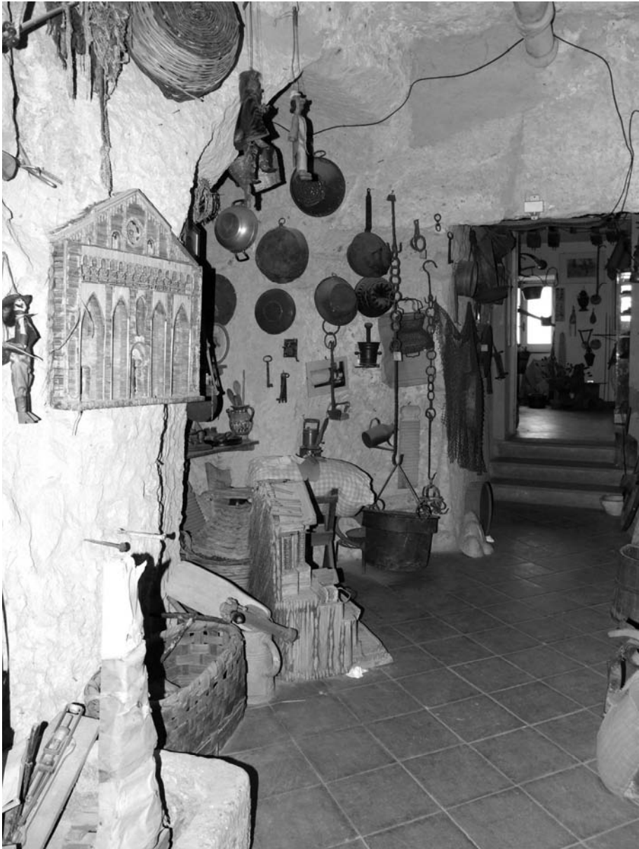
Alcuni scorci del Museo di Etnopreistoria a Castel dell'Ovo.