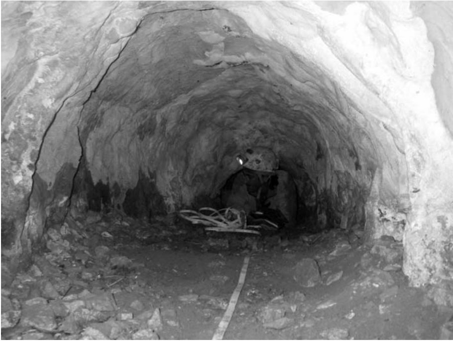
Grotta I Tavaniello, nel Cilento.

Napoli, 1986b), alla continua ricerca di informazioni riguardo le grotte già censite e le segnalazioni. La metodica che viene applicata è completa e prevede la raccolta di tutte le informazioni possibili fra cui l'itinerario per giungere alla grotta e la foto dell'ingresso, che si aggiungono al rilievo, alla descrizione ed alla posizione della grotta. La precisione e la sistematicità adottata da F. Abignente è tale che egli stesso al termine di ogni escursione compila una relazione sull'uscita riportando anche tutte le segnalazioni che non sono affidabili e le cavità che non sono catastabili. Grande importanza viene data alla pubblicazione delle informazioni raccolte, con articoli e comunicazioni che lui stesso scrive per il bollettino sezionale. A lui si deve, inoltre, i contatti e gli scambi con gli speleologi di altre regioni che lavorano in Campania, cosa che produce un effetto positivo per la raccolta di numerose informazioni sulle grotte della Campania.